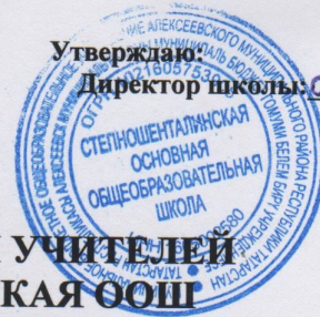
ГРАФИК ПРОХОЖДЕНИЯ АТТЕСТАЦИИ УЧИТЕЛЕЙ МБОУ СТЕПНОШЕНТАЛИНСКАЯ ООШ В ПЕРИОД С 2019 ПО 2024 г.г.